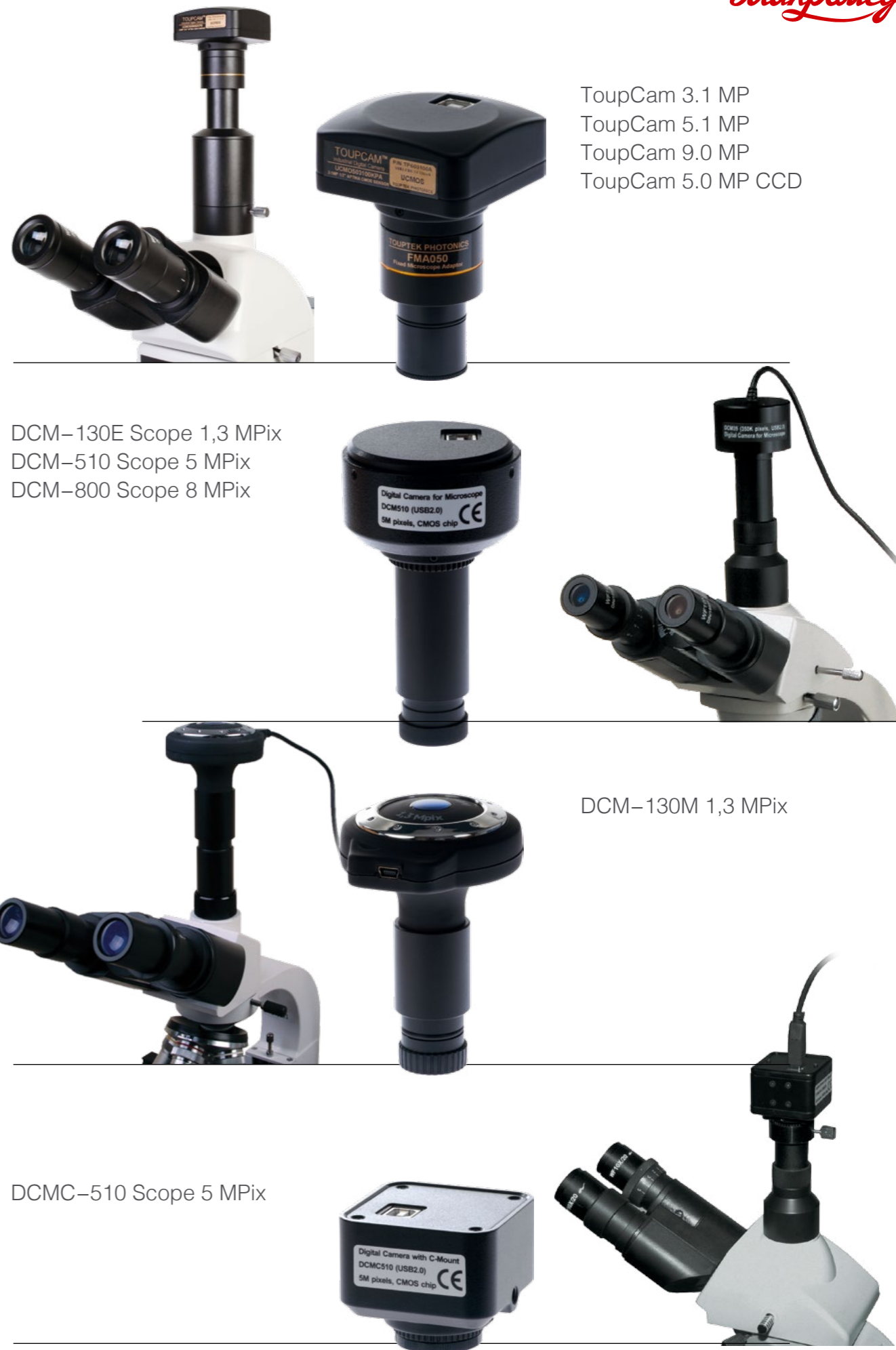
TouPCam 3.1 MP TouPCam 5.1 MP TouPCam 9.0 MP TouPCam 5.0 MP CCD