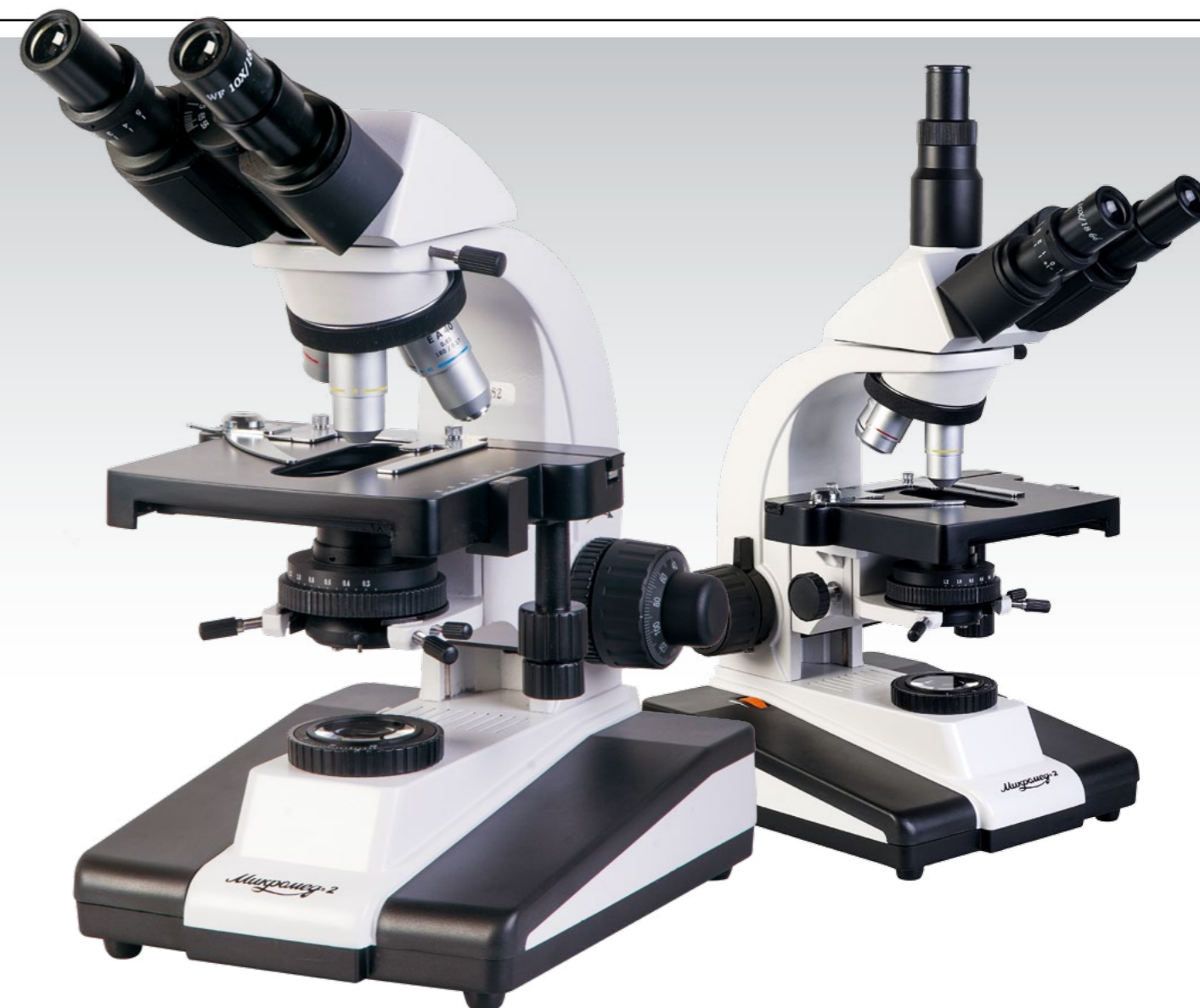
Микромед 2 вар. 2-20

* поставляется по дополнительному заказу