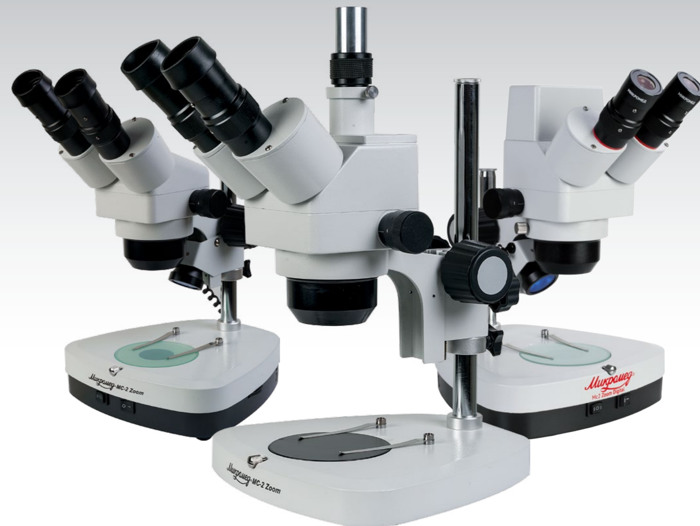
MC-2-ZOOM вар. 1 CR