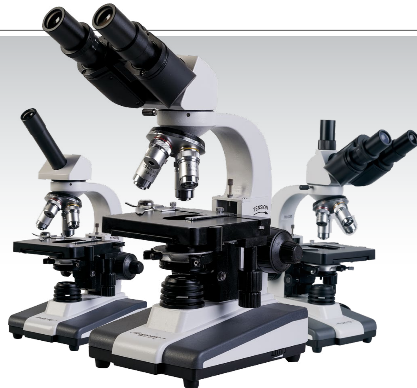
Микромед 1 вар. 1-20