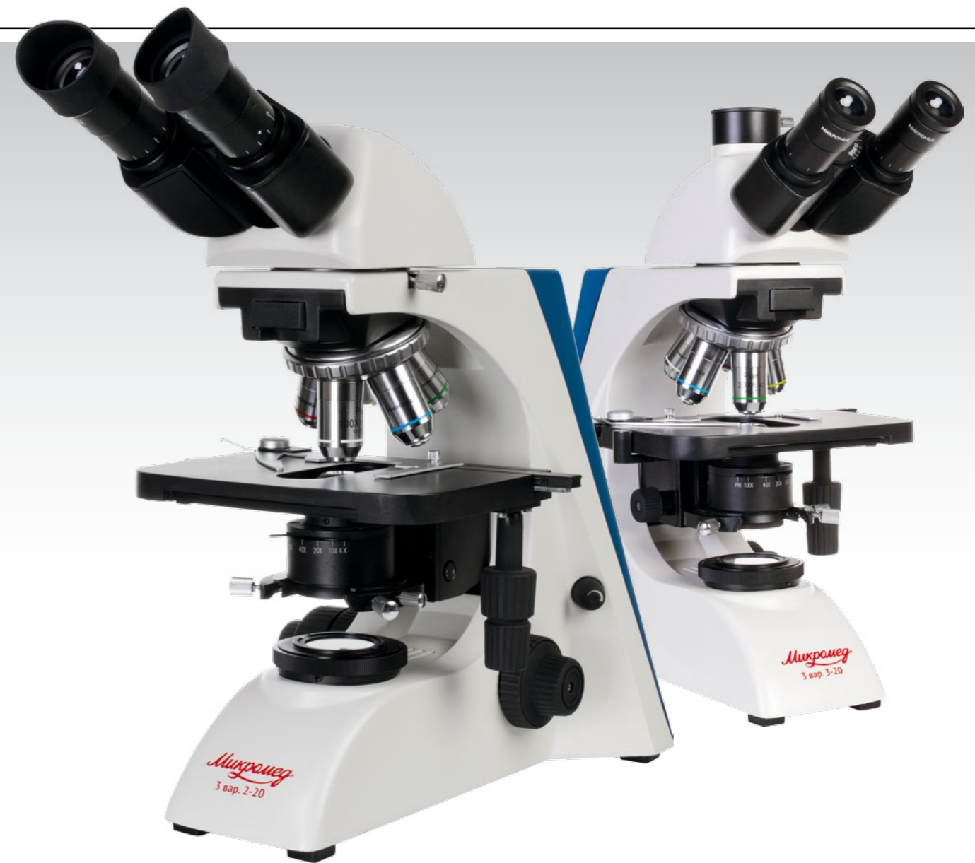
Микромед 3 вар. 2-20М

* поставляется по дополнительному заказу