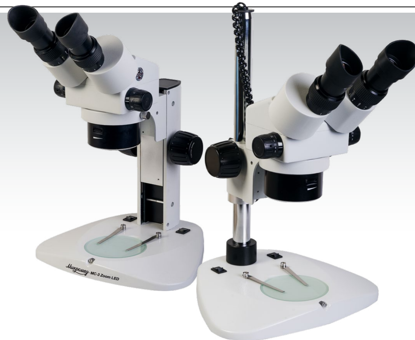
Микромед MC-3-ZOOM LED