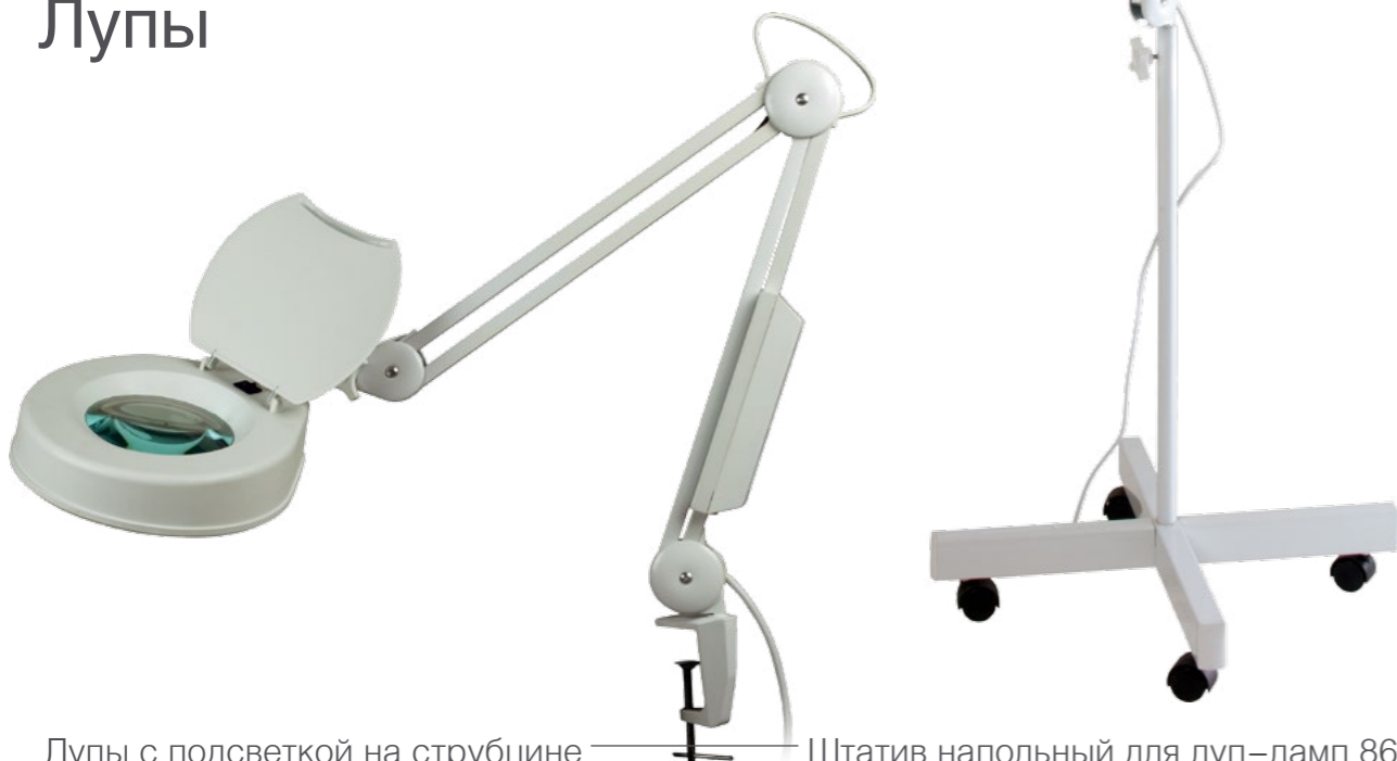
Лупы с подсветкой на струбцине